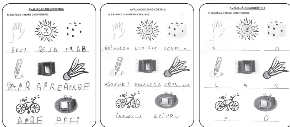
Figura 1 – Exemplos de escritas de crianças com hipóteses pré-silábicas

Conforme a teoria da psicogênese da escrita, elaborada por Ferreiro e Teberosky, os aprendizes passam por quatro períodos nos quais têm diferentes hipóteses ou explicações para como a escrita alfabética funciona: pré-silábico , silábico , silábico-alfabético e alfabético . (Brasil. MEC. SEB, 2012d, p. 11 – Unidade 3/Ano 1 – grifo do autor).